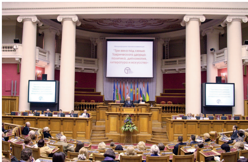
4 декабря 2009 года. Международная научная конференция «Три века под сенью Таврического дворца: политика, дипломатия, литература и искусство»