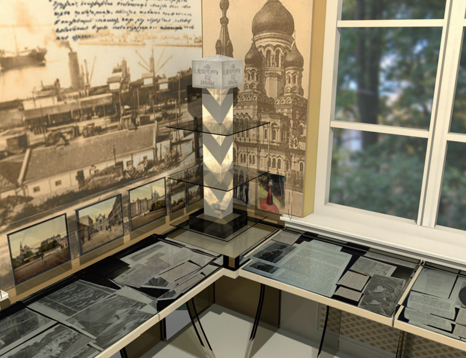
Дизайн-проект выставки «Народы Российской империи: первый опыт парламентаризма»