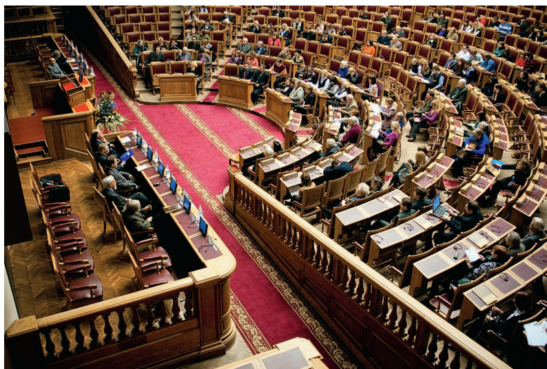
Думский зал Таврического дворца. Пленарное заседание