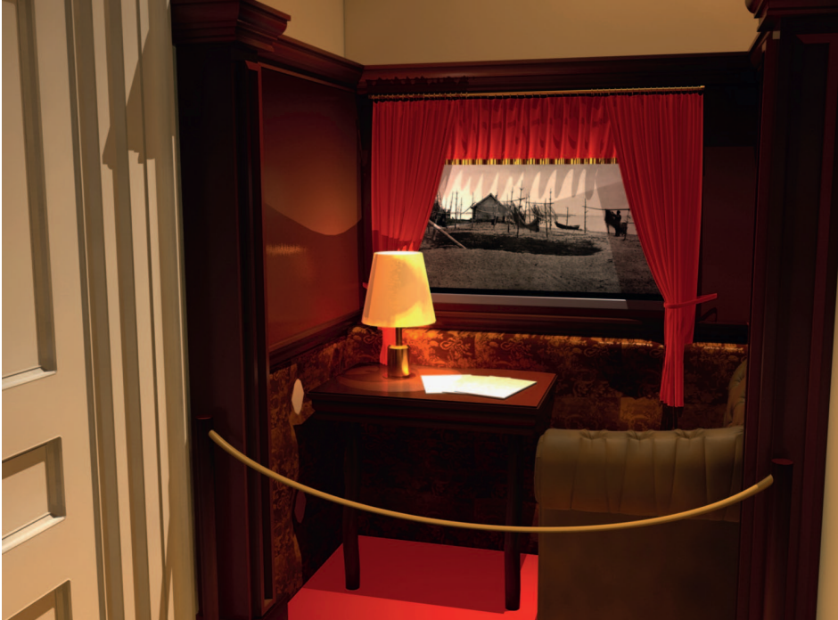
Дизайн-проект выставки «Народы Российской империи: первый опыт парламентаризма» Разработан ООО «Мастерская Инновационной Рекламы» Генеральный директор В. М. Воронин Арт-директор О. В. Заковряшин